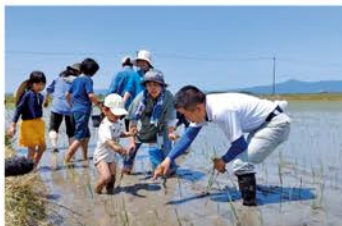
近江米の新品種「きらみずき」の田植えを子どもたちと行いました!

県広報誌「滋賀プラスワン」は、点字版・音声版でも配布しています。音声版の「みんなでプラスワン!」のコーナーは三日月知事の朗読によりお聞きいただけます。