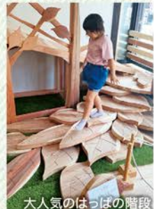
大人気のはっぱの階段

なくなり、試行錯誤しながら始めた「木のおもちゃ」作り。「びわ湖材」を使った事業で採算がとれるようにがんばっています！木育を体験できる「キグミンの森」にぜひ遊びに来てください！