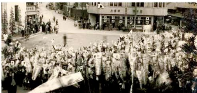
大津市役所前でバンザイする人々