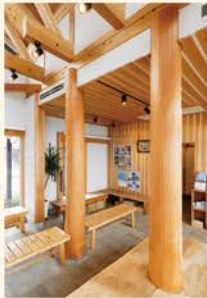
柱は根を張っていた部分を残して利用。大きな木が生えているようなびやかさが漂う空間に。

特にスギは木目が優しく、空間にあたたかい印象を与えるのが魅力なので、環境負荷の抑制や地域経済の発展に寄与する「びわ湖材」を使った建築の良さを肌で感じ、琵琶湖の水とつながる木材を使う意義を知っていただきたいです。