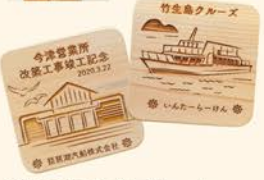
記念品の木製プレート。