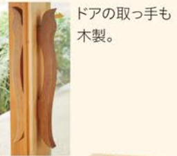
ドアの取っ手も木製。