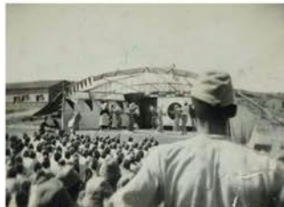
慰問団の舞台を見つめる兵士たち

当時の中国やその周辺地域において、滋賀県民が体験した戦争に関する記憶を、滋賀県平和祈念館が長年にわたって収集してきた関係者の体験談や関連資料などで紹介します。